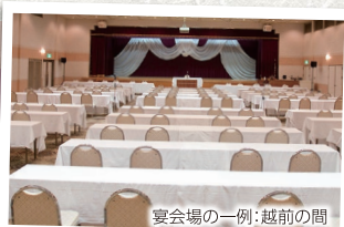
宴会場の一例:越前の間

様々な目的に合わせてご利用頂ける、大小の会場がございます。是非お役立てください。