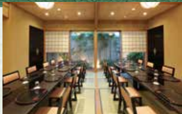
1階 さくら「駿河・遠州」の間

ご参列いただく大切なお客様に、ゆったりとお食事をお愉しみいただける静かな佇まいの個室を用意しております