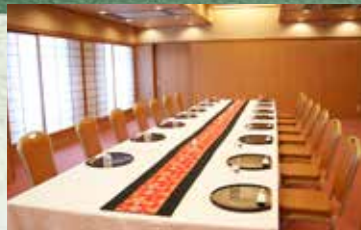
貸切宴会場「桃山」の間