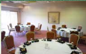
貸切宴会場「鎌倉」の間