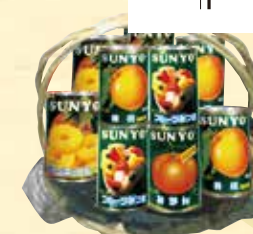
▲ 缶詰供物・・・¥10,800(税込) 【高さ約 35cm 横幅約 30cm】