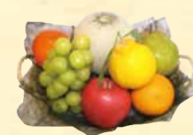
▲ 果物盛 B・・・¥5,400(税込)～ 【電幅約 30cm】