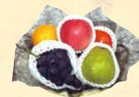
▲ 果物盛 C・・・¥3,240(税込)～ 【電幅約 25cm】