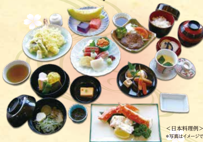
<日本料理例> *写真はイメージです

日本料理、中国料理、西洋料理の中から お好みのコースをお選びいただけます。 いきとどいた心遣い 美味しい心のこもったお料理を、 ご用意させていただきます。 心ゆくまで故人をお偲びください。