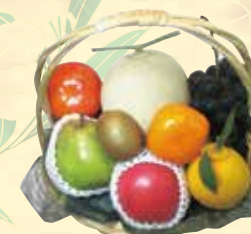
▲ 果物供物 A・・・¥10,800(税込) 【高さ約 35cm 横幅約 30cm】

御霊前にまこころ込めて・・・ 心のこもったお供物を ご用意しております。 厳選してお詰めした果物は ご法要後、ご参列者様に 小分けしてお持帰り頂くことも できます。(※季節により内容は変更になります。)