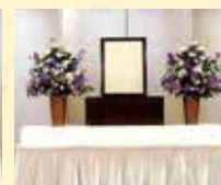
左) 祭壇装花 ……¥27,500(税込) 右) 壺 花 ……¥11,000(税込) ※祭壇設置料は無料になります。