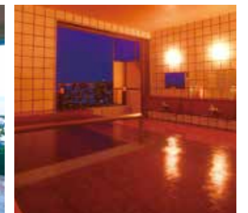
【貸切りラックスバス】