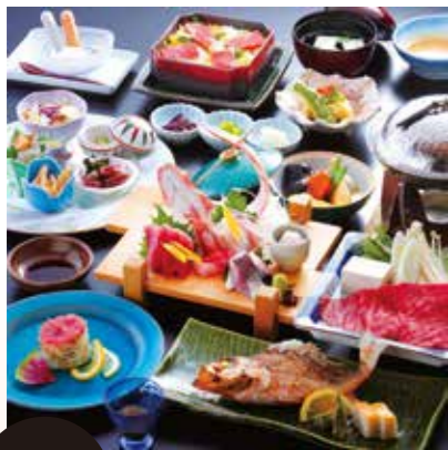
氷見の方にも 一番人気の お料理