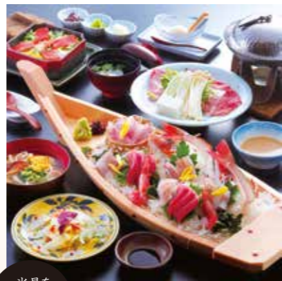
氷見を よく知る方に おすすめ

舟盛り板前技の逸品も同時に食べたい。氷見らしく、魚の煮つけや塩焼きも取り入れて、量も質も堪能できると好評の魚尽くし料理です。