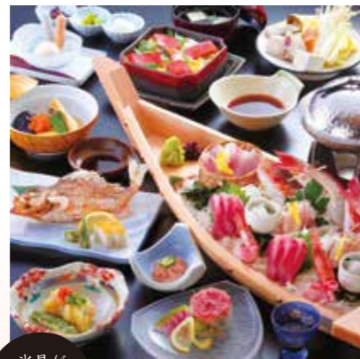
氷見が 初めての方に おすすめ

いわゆる旅館料理は嫌いという方にも大好評。氷見の海山の幸をふんだんに取り入れ、料亭料理の奥深さと、割烹料理の新鮮さが満喫できます。