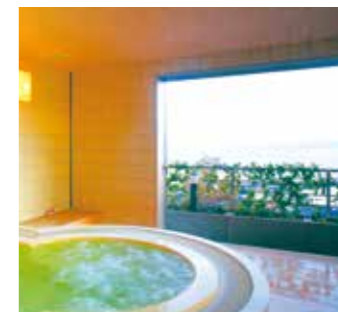
【貸切ジャグジーバス】

6名様ほどお入りいただける広めの温泉家族風呂が2箇所ございます。露天ではありませんが、海一望の展望風呂です。みずいらず楽しい時間を過ごせるとカップル、ご夫婦はもちろん、お子様連れのご家族や、少し介助の必要なお客さまにも大好評です。